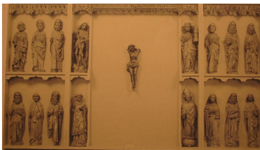
Det gamle alterparti

På alteret er der et smukt træskærearbejde fra o.1475_1500, en krucifiksgruppe. Den Korsfæstede med Maria Jesu moder og apostelen Johannes ved siderne. Figurene har antagelig tidligere været i en korbuekrucifiksgruppe. I Nogle figurer fra Hjarup kirkes tidligere altertavle findes på Koldinghus museum, det er de 12 apostle og 4 helgenfigurer, det er