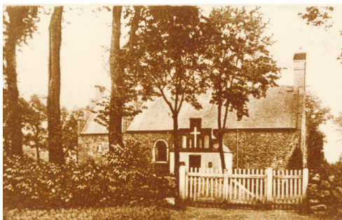
Ældste billede af kirken og den gamle indgang

Kirken var i 1868 i meget dårlig tilstand, og den var for lille til menigheden. Kirken blev meget ombygget. Skibets og korets nordside blev bevaret, resten blev ommuret, man anvendte det gamle materiale. Skibet blev forlænget med 5, 5 m. mod vest og skibets ret store bredde på 10,9 m. blev uændret. Blytaget blev solgt og det nye tag blev skifertag. I østgavlen sidder der buede kvadre fra en apsis, der var nedrevet før 1868. Ombygningen foretoges ved arkitekt L.A.Winstrup. Det indre af kirken præges af en restaurering ved arkitekt J. K. Jepsen, Kolding i 1956-57.