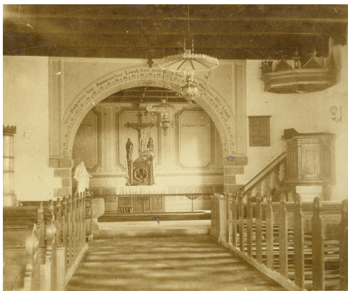
Det ældste billede af kirkens indre (omkring 1920)

Kirkeklokken, der bruges, er ophængt i en klokkestabel på kirkegården. Klokken er støbt hos Eisbouts i Holland i 1979 , den har føl- gende indskrift fra Sl. 89 v. 1: "Om Herrens nåde vil jeg evigt synge". Klokken i klokke- buen bruges ikke mere. Der er 2 gravminder fra henholdsvis 1613 og 1645, de er indmuret i vestmuren. I modsætning til prangende epi- tafier er det beskedne plader i kalksten, men med en kort og saglig indskrift.