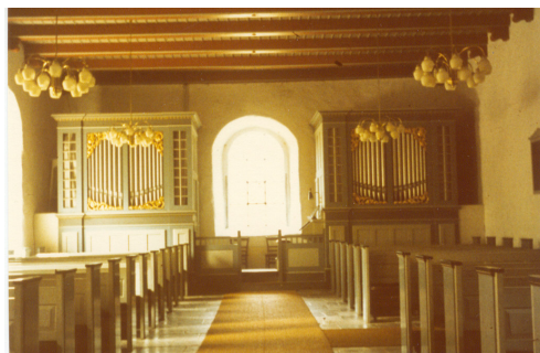
Det gamle orgel før 1971