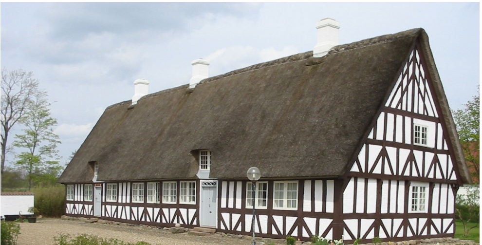
Hjarup præstegård, som den ser ud i dag